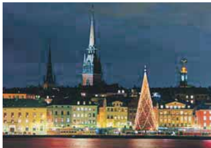
Skeppsbron i Stockholm.

Du kan enkelt og komfortabelt komme deg til julebyen Gøteborg med toget. NSB bruker 4 timer og 20 minutter til Gøteborg sentrum, og uten spesialpris koster det i underkant av 500 kroner en vei. Kalkulatoren til NSB beregner imidlertid minipris hvis billetten er bestilt og kjøpt en dag i forveien, så husk å sjekke prisene nøye. Svånska Järnvegen tilbyr buss i stedet for tog på strekningen Oslo – Gøteborg, den tar fire timer. I et land som fortsatt har adel, opererer de med to klasser.