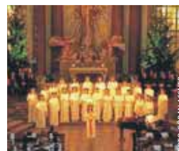
Den tradisjonelle Lucia Choir i Göteborg Domkirke.