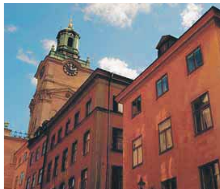
Gamla Stan i Stockholm.

Et godt råd kan være å bruke tid på å utforske aktuelle eiendomsmeglere, og større kjeder kan være trygge å handle med. Man skal alltid undersøke sine juridiske plikter og rettigheter ved kjøp av eiendom i utlan-