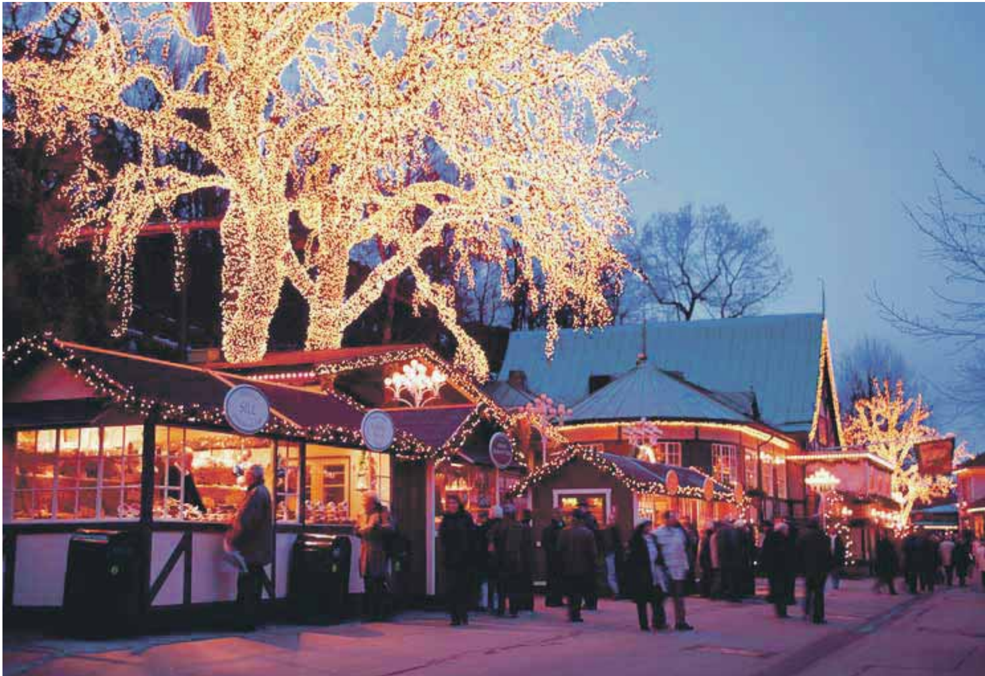
Julemarked på Liseberg fornøylespark.