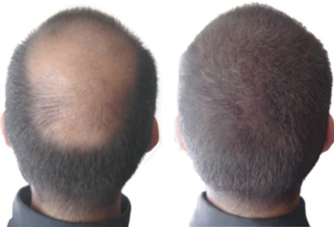
prima e dopo l'applicazione di kmax microfibre

La capigliatura appare subito più folta e non si intravede più il diradamento tra i capelli, cosicché non ci si deve più preoccupare dell'inestetismo del diradamento quando si sta in compagnia, sul luogo di lavoro, durante eventi o cerimonie importanti e sotto la luce intensa di fonti luminose.