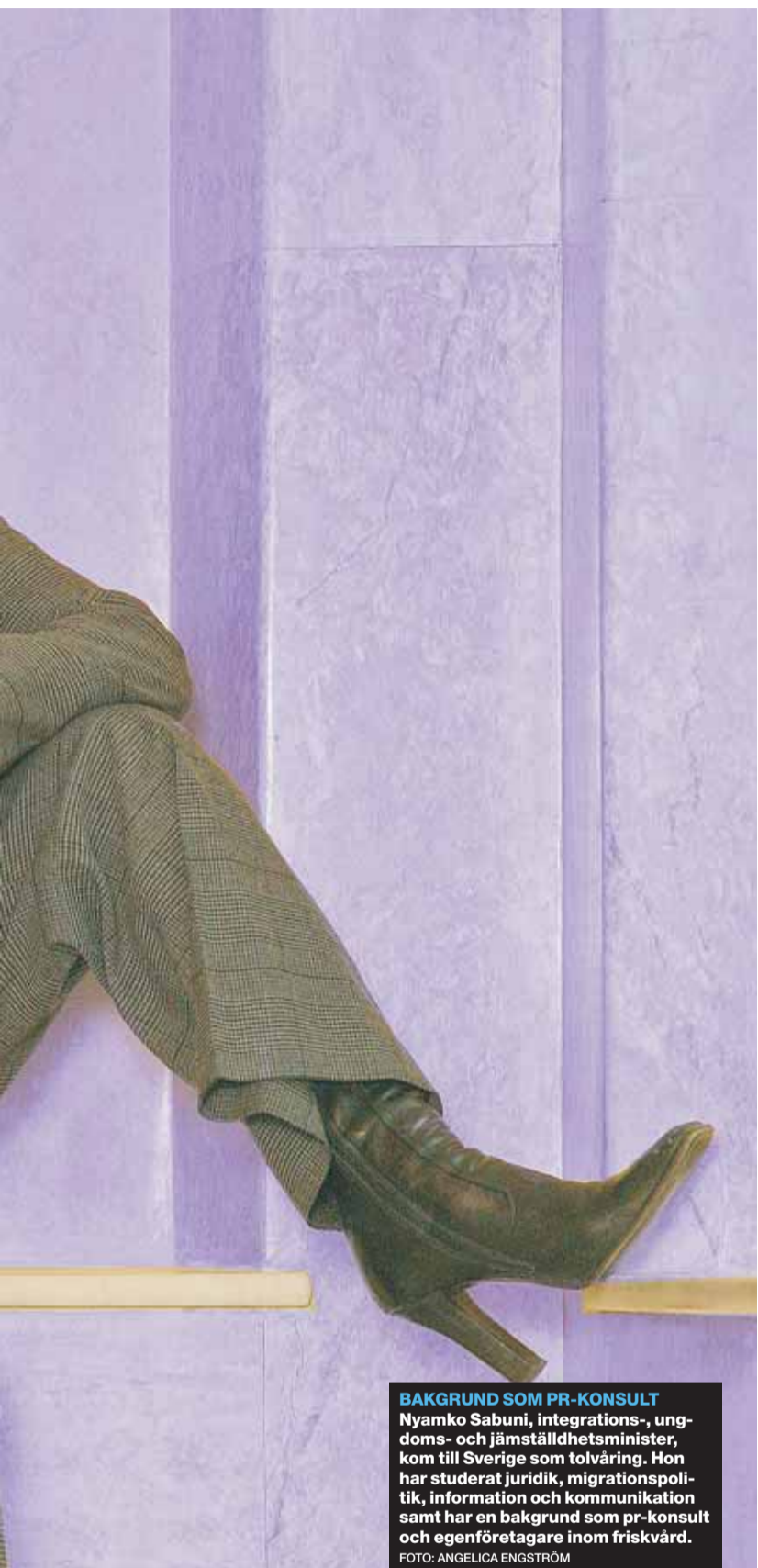
BAKGRUND SOM PR-KONSULT Nyamko Sabuni, integrations-, ungdoms- och jämställdhetsminister, kom till Sverige som tolvåring. Hon har studerat juridik, migrationspolitik, information och kommunikation samt har en bakgrund som pr-konsult och egenföretagare inom friskvård.