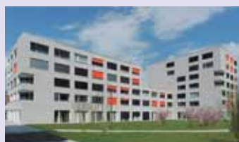
Ecublens 44 logements + 11 studios étudiants