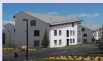
Pra Roman – 61 logements

ALTERIMO gérance spécialisée dans les logements protégés (adaptés et accompagnés) pour personnes âgées et/ou à mobilité réduite. Contactez-nous pour toutes informations, brochures de présentation et dossiers d'inscription concernant nos immeubles déjà construits ou nouveaux sites en cours de location.