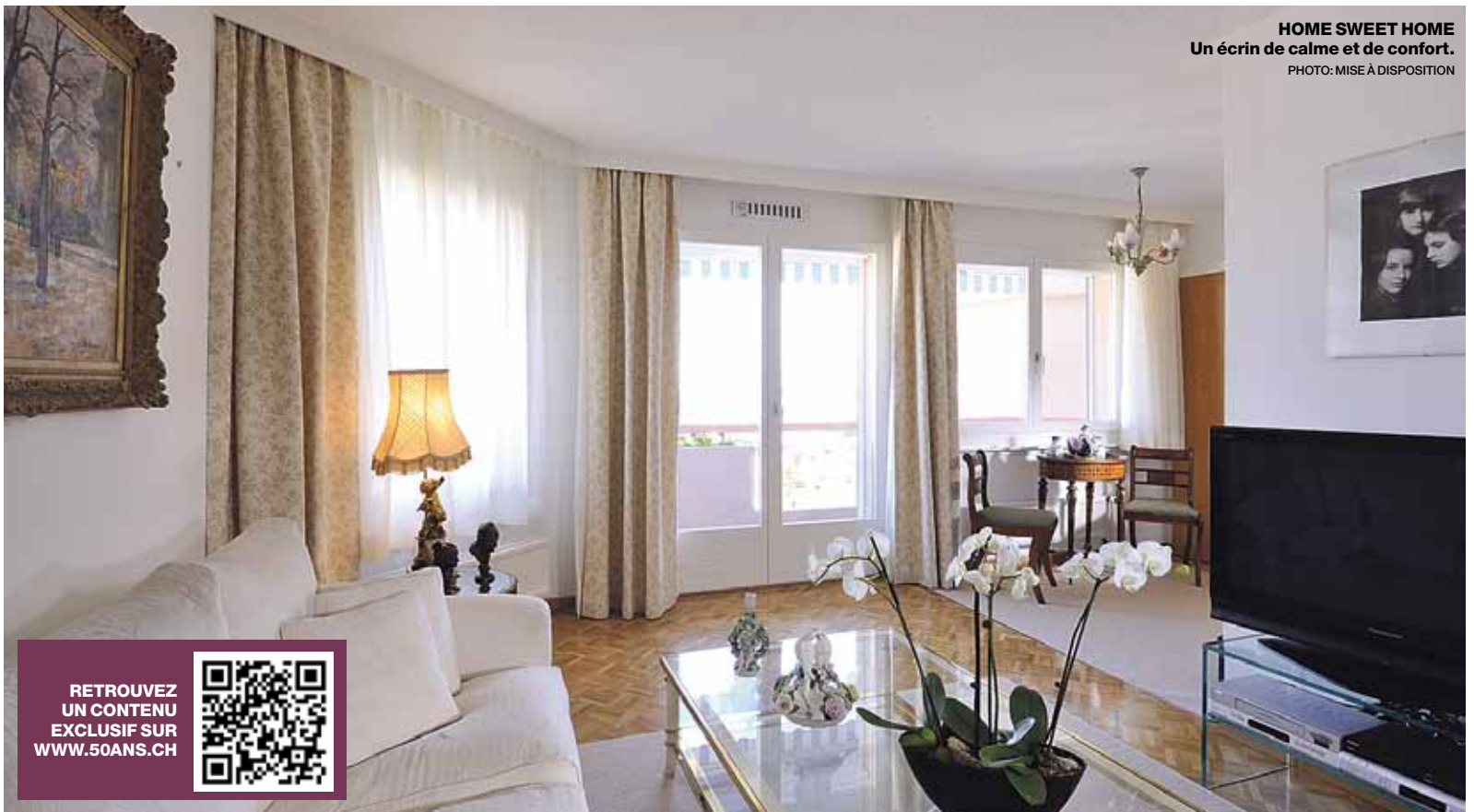
HOME SWEET HOME Un écrin de calme et de confort.

RETROUVEZ UN CONTENU EXCLUSIF SUR WWW.50ANS.CH