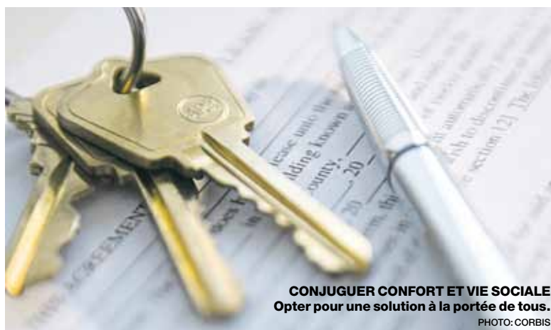
CONJUGUER CONFORT ET VIE SOCIALE Opter pour une solution à la portée de tous.

Dans le premier cas, la personne doit être autonome et indépendante. Par contre, il permet souvent de repousser le transfert en EMS puisque les ap-