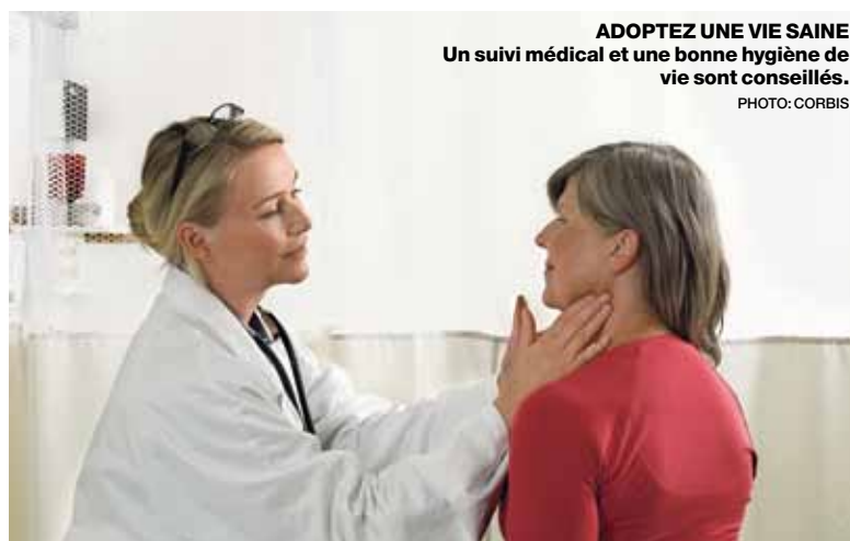
ADOPTÉZ UNE VIE SAINE Un suivi médical et une bonne hygiène de vie sont conseillés.

D'abord en gardant une activité régulière et naturelle puis en vivant de manière saine. Il est également essentiel de faire les tests de dépistage des principaux cancers. J'aimerais d'ailleurs en profiter pour insister sur l'importance