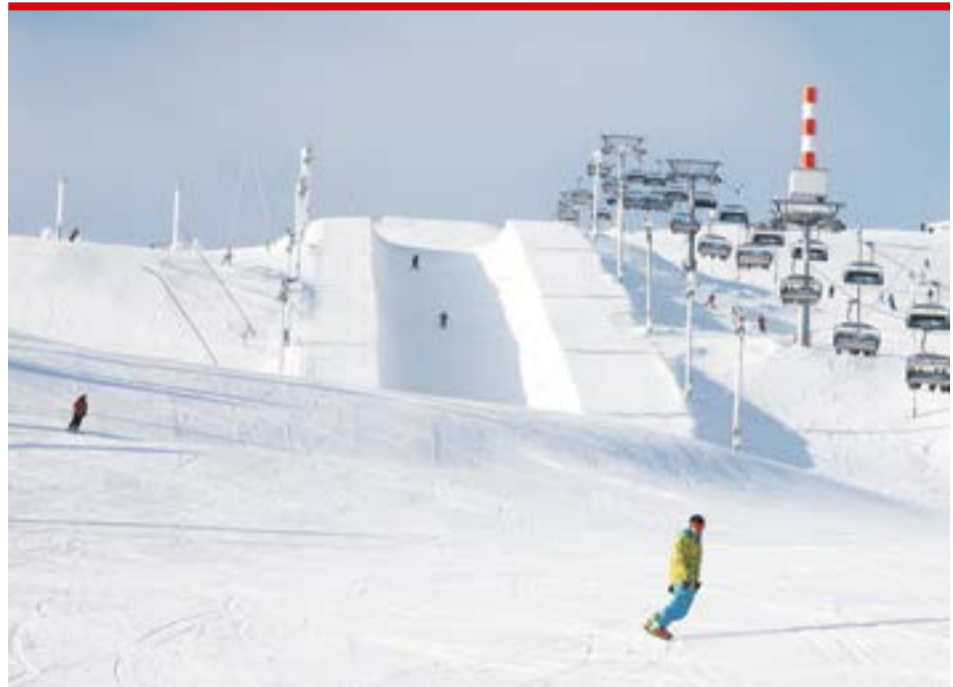
ФОТО: ГОРНОЛЫЖНЫЙ КУРОРТ РУКА / RUKAKESKUS LTD