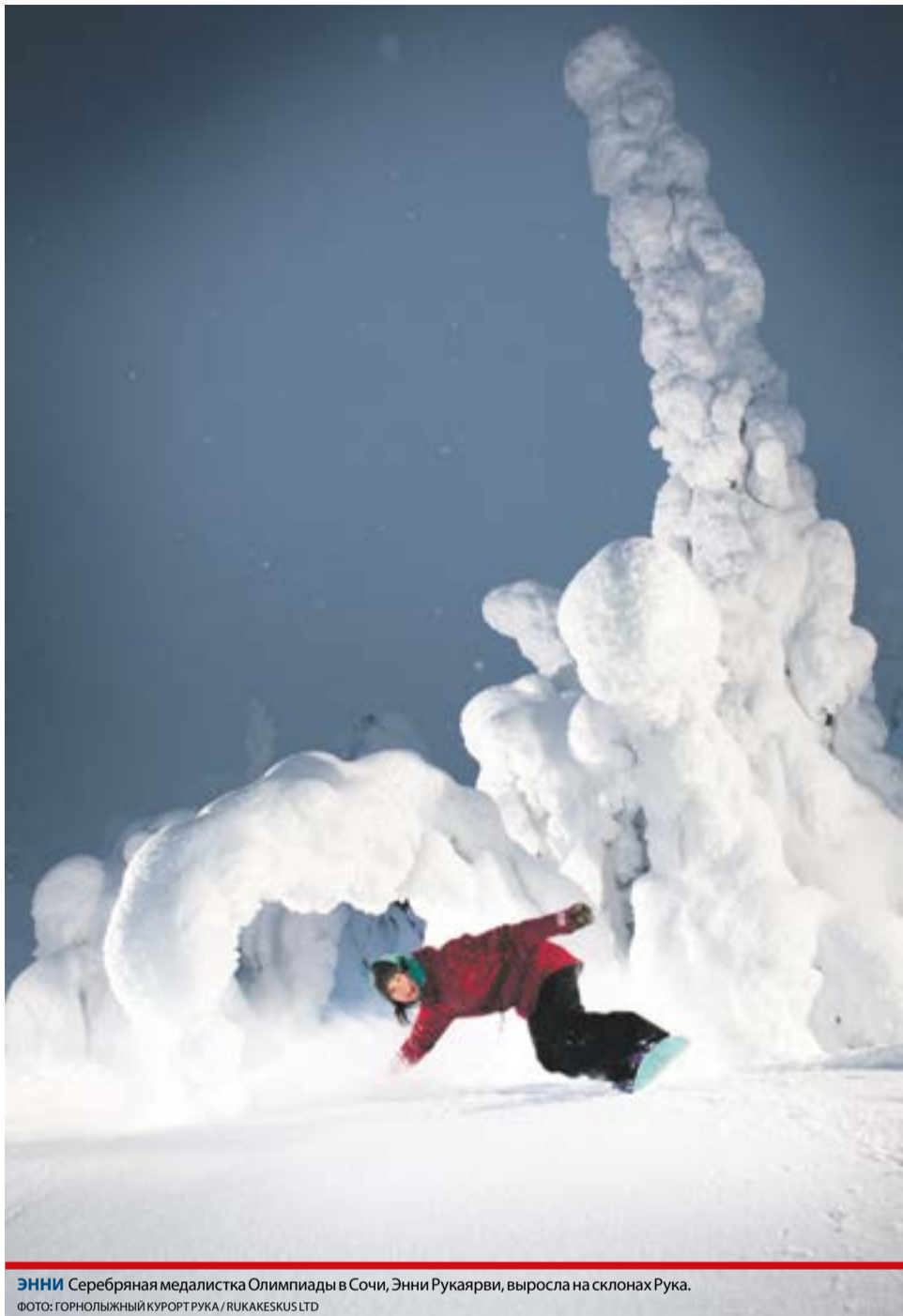
Энни Серебряная медалистка Олимпиады в Сочи, Энни Рукаярви, выросла на склонах Рука.