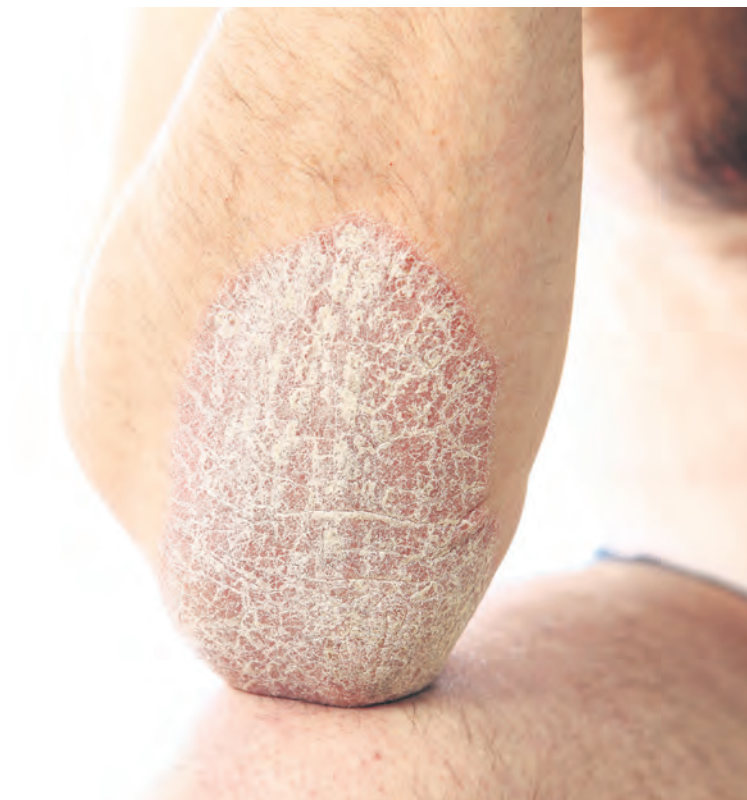
SCHUPPENFLECHTE tritt oft mit vielerlei Begleiterkrankungen wie Diabetes oder Morbus Crohn auf.

Viele Betroffene leiden zudem unter Begleiterkrankungen der Psoriasis. Dazu zählen unter anderem das metabolische Syndrom, Herzkreislauferkrankungen, Diabetes mellitus und Morbus Crohn. Durch eine gesunde Lebensführung und regelmäßige Kontrolluntersuchungen können Patienten einigen dieser Krankheiten vorbeugen beziehungsweise deren teilweise schwerwiegenden Folgen rechtzeitig verhindern.