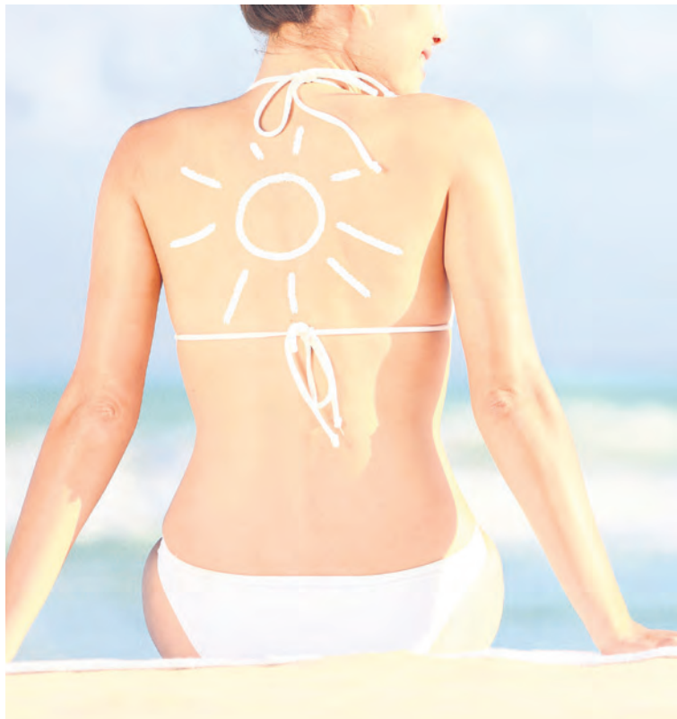
SCHÖN BRAUN. Sonnen ja – aber bitte gesund!

Schnelles Bräunen ist ungesund. Die Haut muss langsam systematisch an die Sonneneinstrahlung gewöhnt werden. Wer ein schnelles Bräunungsergebnis wünscht, kann dies alternativ auch mit UV-freien Bräunungsduschen im Sonnenstudio erreichen. Denn die pflegende Bräune aus der Kabine ist UV-frei und bräunt innerhalb von wenigen Minuten. Auch Sonnenanbeter mit empfindlicher Haut kommen so in den Genuss, knackig gebräunt auszusehen, ohne dabei die Haut zu strapazieren. Der aufgesprühte Selbstbräuner auf Rohrzuckerbasis reagiert mit der oberen Hornhautschicht und sorgt dafür, dass sie sich in einer individuell bestimm-