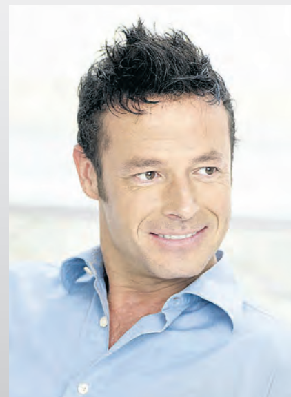
Svenson Kunde mit Integrationssystem: vorher / nachher