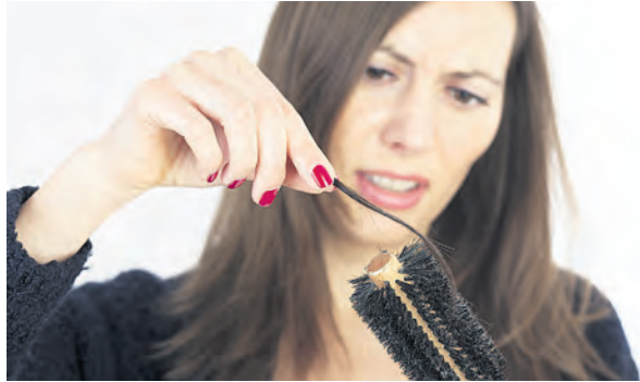
NICHT VERZWEIFELN. Für viele Arten des Haarausfalls gibt es Hilfe.

Zwischen 100.000 und 150.000 Haare hat ein gesunder Mensch auf dem Kopf. Und jedes Haar wächst dort etwa sechs bis acht Jahre, bevor es ausfällt und ersetzt wird. Es ist also ganz natürlich, dass täglich Haare in Kamm oder Bürste bleiben. Erst ab über 100 Haaren Verlust pro Tag spricht man von Haarausfall und dieser kann viele Gründe haben.